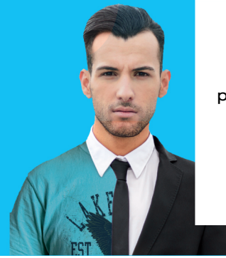
photo d'identité à coller ici

Etablissement d'enseignement supérieur technique privé